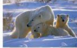
БІЛИЙ ВЕДМІДЬ – господар Арктики. Найбільший сучасний сухопутний хижак