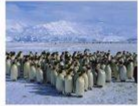
Пінгвіни-типові жителі Антарктиди