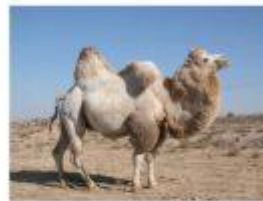
Верблюди — це давні мешканці пустель. Крім того, це перша тварина, яку приручила людина. Верблюди не відчувають агресії по відношенню до людей. Особливо вони добрі з дітьми.