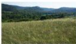
Степ та лісостеп

Це суцільний килим із трави. Дощить тут рідко, тому й дерев майже немає. Тут живуть койоти, лисиця, ховрашок, миші, орел.